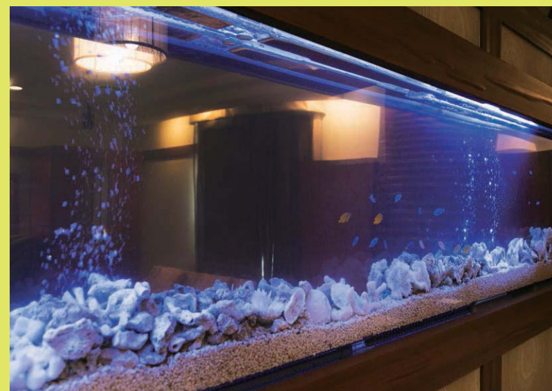
大きな水槽の中で泳ぐ熱帯魚。南国気分を盛り上げてくれること間違いなし