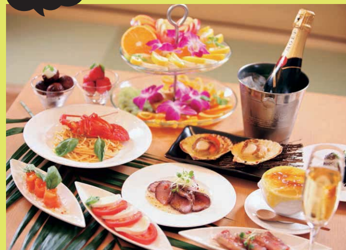
料理やドリンク、スイーツなどゲストのニーズに応える品揃え