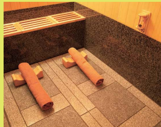
(上)まるで温泉のような信楽焼の露天風呂でほっこりできる302号室。(下)「プレジデント」「ロイヤル」「エグゼクティブ」の計8部屋に設置されている岩盤浴で二人きりの岩盤浴デートを楽しめる