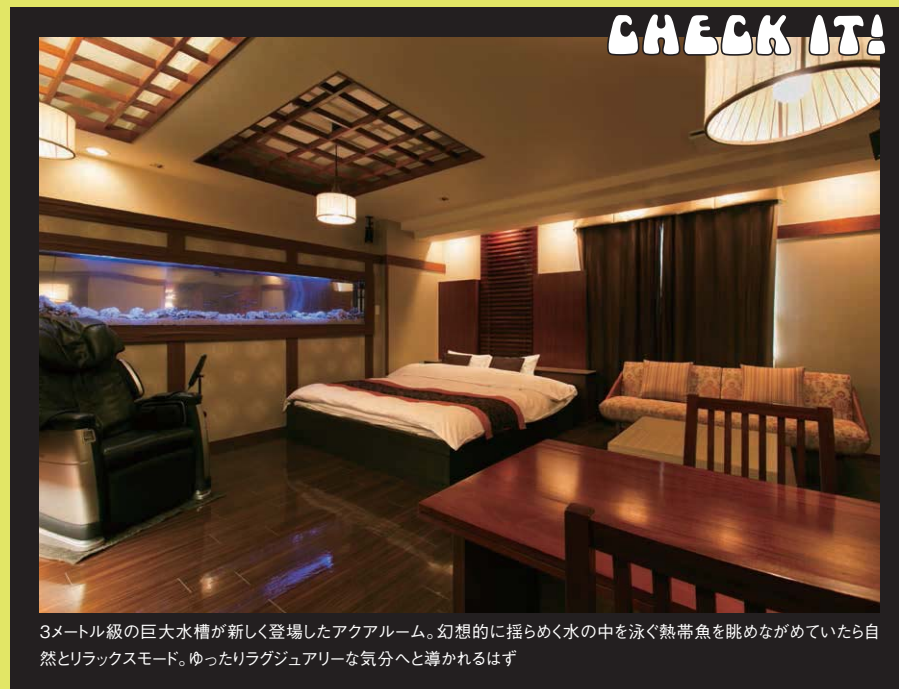
3メートル級の巨大水槽が新しく登場したアクアルーム。幻想的に揺らめく水の中を泳ぐ熱帯魚を眺めながめいたら自然とリラックスモード。ゆったりラグジュアリーな気分へと導かれるはず