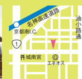
京都市伏見区竹田東小屋ノ内町61 無休 P58台

休憩 3990円～1万900円、土・日曜・祝日4990円～1万1990円 (6:00～20:00 / 1h, 20:00～24:00 / 3h) サービスタイム 4990円～1万4900円 (6:00～10:00 in 10h, 10:00～13:00 in 8h, 13:00～16:00 in 7h, 16:00～18:00 in 6h), 5990円～1万6900円 (18:00～20:00 in 5h), 土・日曜・祝日5590円～1万5900円 (6:00～10:00 in 6h, 10:00～13:00 in 5h, 13:00～18:00 in 4h), 6590円～1万7900円 (18:00～20:00 in 3h) 宿泊 8990円～2万7900円、金曜9990円～2万8900円 (18:00～翌10:00, 20:00～翌12:00, 24:00～翌15:00), 土曜・祝前日1万9900円～2万9800円, 日曜8990円～2万7900円 (21:00～翌11:00, 24:00～翌12:00, 27:00～翌13:00) 延長 1090円～2790円 (0.5h)、土・日曜・祝日1190円～2900円 (0.5h) その他 SPA:リラクサアロママッサージ2900円 (0.5h) など ※SPAのみの利用可