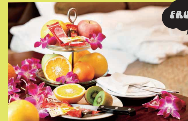
特別室ではフルーツ盛り合わせが無料